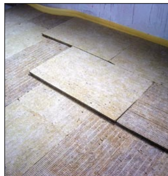
Dvoslojna križno položena zvočna izolacija, Burger d.o.o.

Vzporedno z ocenjevanjem se je leta 2003 nadaljeval tudi razvoj projekta ZKG. Rdeča nit sprememb je bila razvoj dobre gradbene prakse (DPG) na tematskih področjih. Tako je bil pripravljen projekt ocenjevanja izvedbe cementnih estrihov. Večni vir sporov je predvsem v stanovanjskih stavbah čezmeren hrup, ki naj bi ga s pravilno sestavo plavajočih estrihov spravili na dovoljeno raven.