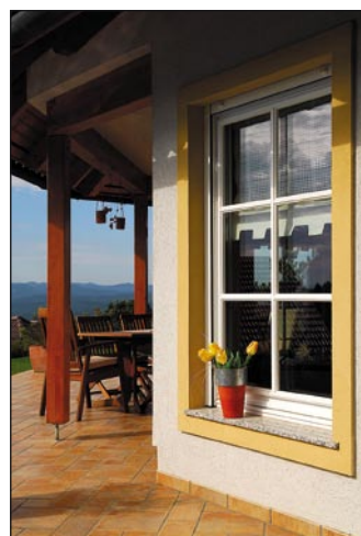
Okno D01, Marles hiše

V letu 1999 je bilo razpisanih deset področij ocenjevanja in v Gornji Radgoni podeljeno devet znakov kakovosti. Pripravljeni sta bili dve novi področji ocenjevanja, strešna kritina ter betonski tlakovci in plošče, pri katerih se niso upoštevali stari standardi JUS, temveč predlogi naprednejših EN standardov in pravila dobre gradbene prakse.