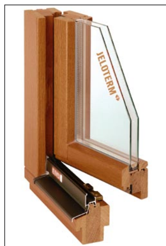
Okno Jeloterm, Jelovica

Prvi trije znaki kakovosti za okna in izdelke nasploh so bili podeljeni leta 1997 na vsakoletnem sejmu gradbeništva in gradbenih materialov Megra v Gornji Radgoni. Nagrajeni dobitnikov so bili: okno Jeloterm, Jelovica