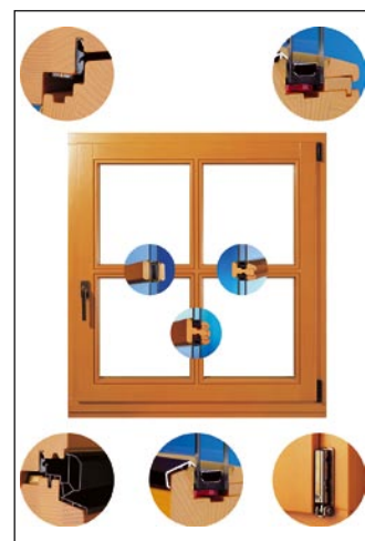
Okno INO-68, Inles